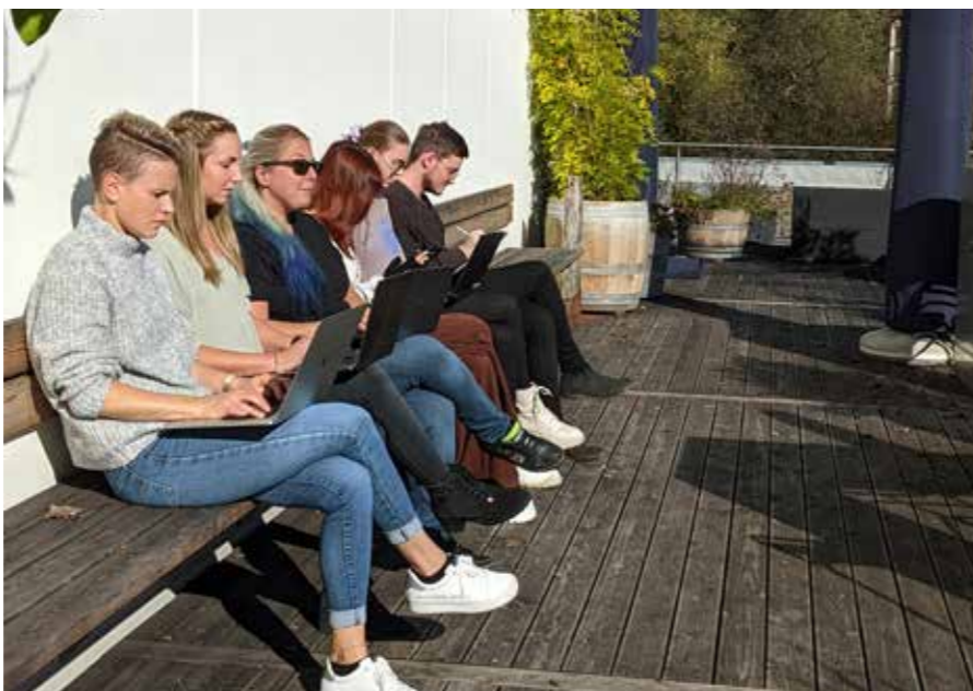
Bei NCM kann bei Schönwetter auch auf der Sonnenterrasse gearbeitet werden.

1996 gegründet, blickt die Digital-Agentur auf eine lange und erfolgreiche Geschichte zurück, die täglich vom dynamischen Team weiter-