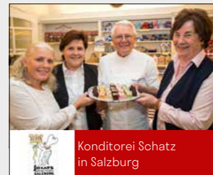
Konditorei Schatz in Salzburg

Ob Tourismusbetrieb, Onlineshop, Blog, B2B- oder B2C-Unternehmen – Vereinbaren Sie gleich einen Termin telefonisch unter +43(0)662644688 oder per Mail unter info@ncm.at . Die NCM berät Sie gerne! ■