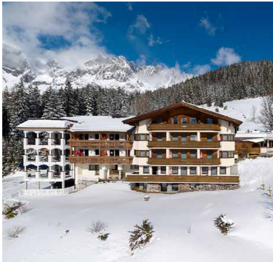
Nicht nur die Gäste, sondern auch Mitarbeitende fühlen sich sofort wie zuhause im 4-Sterne Hotel Bergheimat inmitten der Salzburger Berge.

Mittels Social-Media-Recruiting und einer individuell an den Betrieb abgestimmten und „Awareness-schaffende“ Social-Media-Kampagne, weckt man das Interesse von Arbeitssuchenden und zwar genau dort, wo sie sich am häufigsten aufhalten: Facebook, Instagram, YouTube und Co. Deshalb setzen Sie im Bewerbungs-