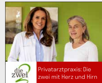
Privatarztpraxis: Die zwei mit Herz und Hirn