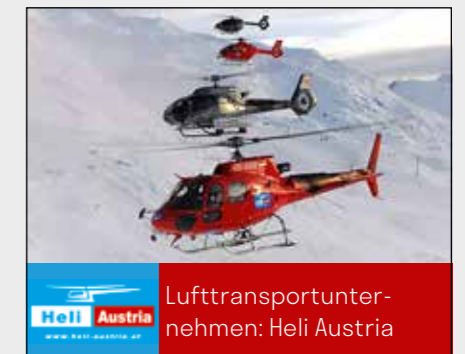
Lufttransportunternehmen: Heli Austria