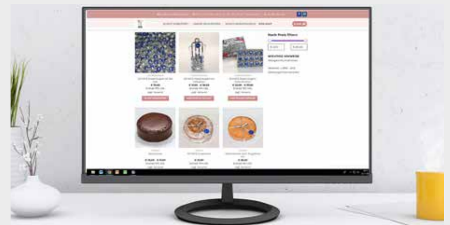
Die Website der Traditions-Konditorei Schatz lädt zum Naschen ein.

Der Ausbau des „süßen“ Web-Auftritts der Salzburger Schatz Konditorei, die ansprechende Heli Austria Website oder die Online-Lösung der sympathischen Salzburger Privatärztinnen „Die zwei mit Herz und Hirn“ beweisen: Die Net Communication Management GmbH macht nicht nur Touristiker:innen glücklich. Das breit gefächerte NCM-Expertenwissen reicht