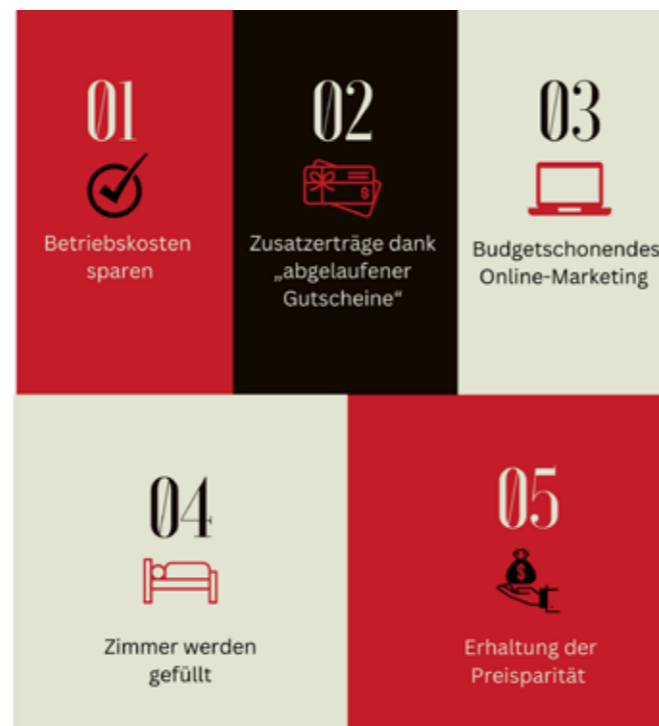
Die Vorteile des hoxami-Gutscheinsystems.

davor, dass ihnen der Verkauf von „günstigeren Zimmerpreisen“ über Drittanbieter einen Strich durch die forcierte Preisparität machen. Keine Sorge bei Gutscheinverkäufen über den hoxami Gutscheinhändler – diese werden online nicht im direkten Namen Ihres Betriebs erworben und senken so in keinem Fall das generelle Preisniveau Ihres Betriebes. ■