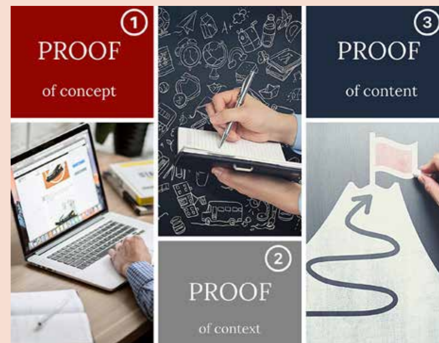
Die ersten 3 Schritte von wirklich erfolgreichen Websites.

Proof of concept, proof of context, proof of content – am Anfang einer jeden neuen NCM-Website werden der aktuelle Status-Quo und die Wünsche und Ziele des Betriebs ermittelt. Anschließend werden die relevanten, „Personas-bezogenen“ Inhalte im Zuge von Themen- und Mitbewerber-Recherchen ermittelt. Darauf aufbauend erstellt das NCM-Expertenteam gemeinsam mit den Kund:innen eine themenrelevante Sitemap mit SEO-optimierten Inhalten. Diese Vorgehensweise stellt sicher, dass Ihre Website ab dem Onlinegang organische Reichweite generiert, relevanten Traffic erzeugt und somit schnelle Erträge bringt.